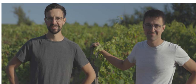
Domaine des Frères - Loire - Deuxième Prix