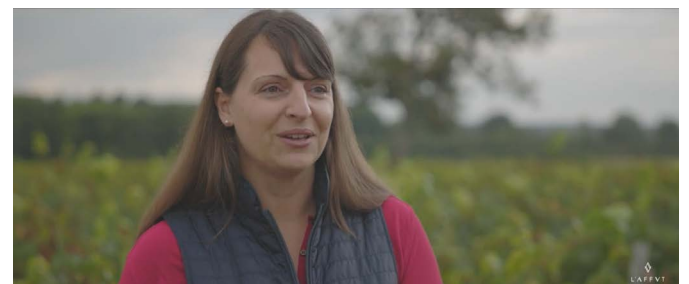
L'Affût - Loire - Troisième Prix