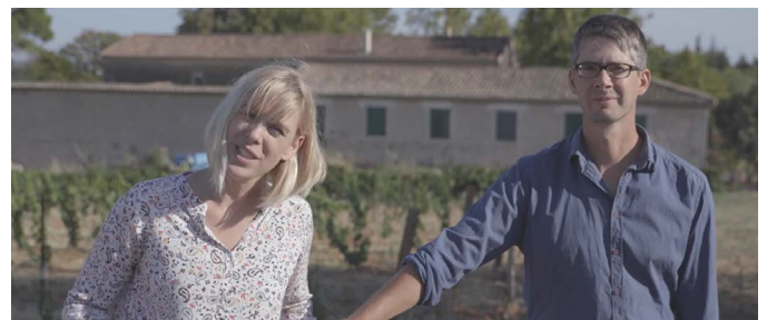
Domaine Ampelhus - Languedoc - Premier Prix

https://www.youtube.com/c/AdViniDiffusion